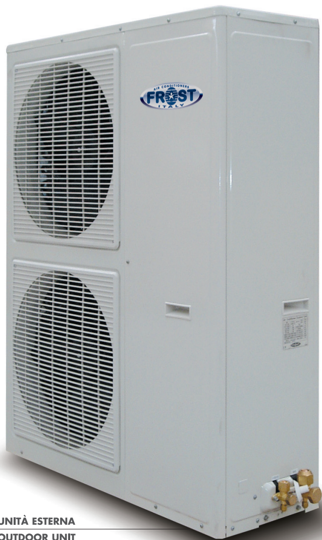
UNITÀ ESTERNA OUTDOOR UNIT

DIE SPLIT-KONSOLEN ODER DECKENGERÄTE von FROST ITALY sind eine Lösung für jeder ein kompakte und formschön Gerät wünscht, das auf Boden oder auf Wandfläche und Wohnstätte geeignet. Die Baureihe besteht aus Modellen mit einer Kälteleistung vom 7 bis 12 kW. Alle die Geräte versehen mit einer Infrarot-Fernbedienung und kann man sie mit den Verflüssigereinheiten von der Firma FROST ITALY koppeln.